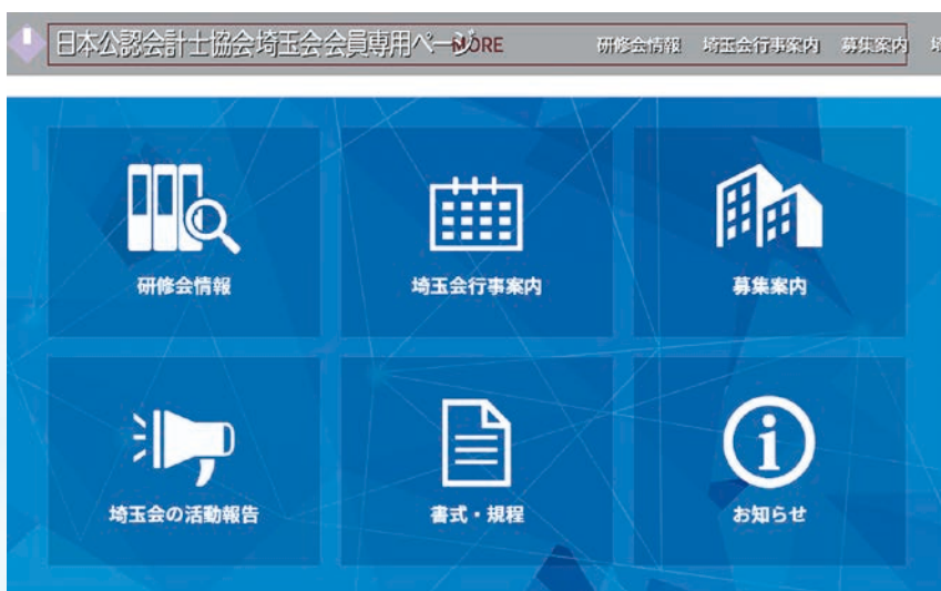
パソコン上の画面