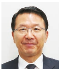
北村 信 財務省関東財務局長